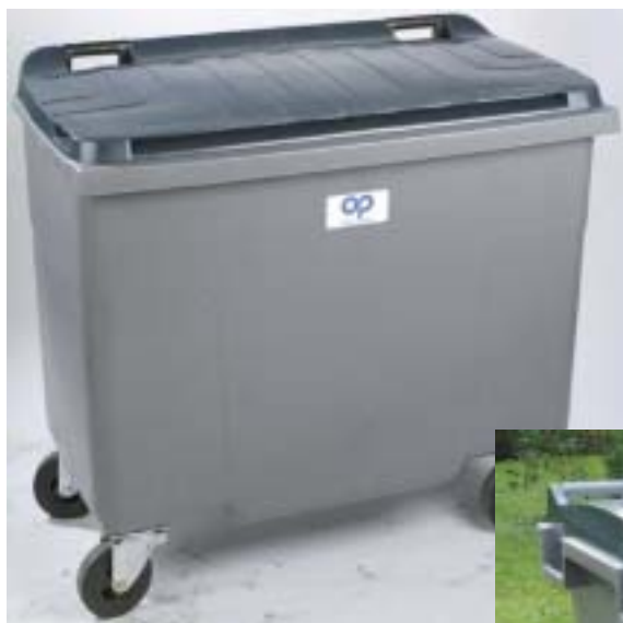
BR 500 L

Samtliga kärl är tillverkade av återvinningsbar, UV-stabiliserad HD-polyeten, som tål hårt slitage och tufft klimat. Kärlen kan även tillverkas i återvunnet material. Kärlen uppfyller europa-standarden EN-840 (SS-EN 840:1-6) och passar till såväl sid- som baklastande fordon.