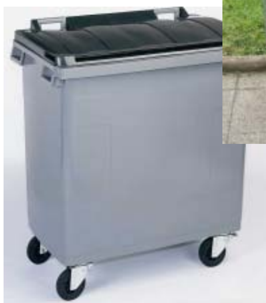
BR 770 L