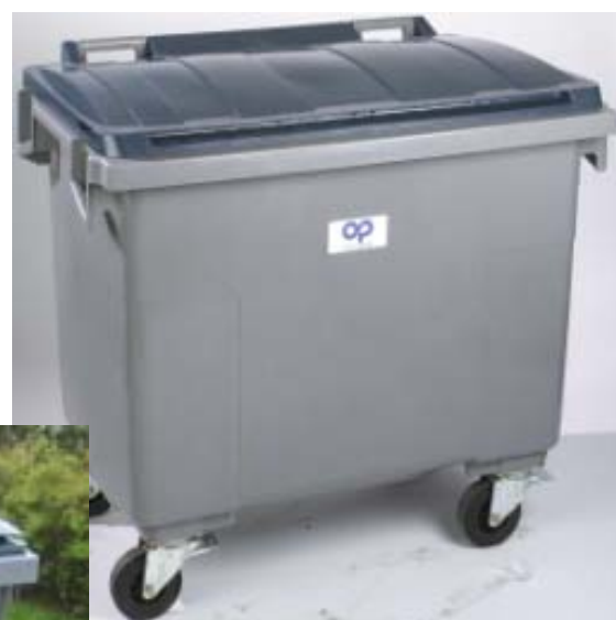
BR 660 L