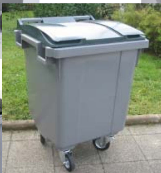
BR 400 L