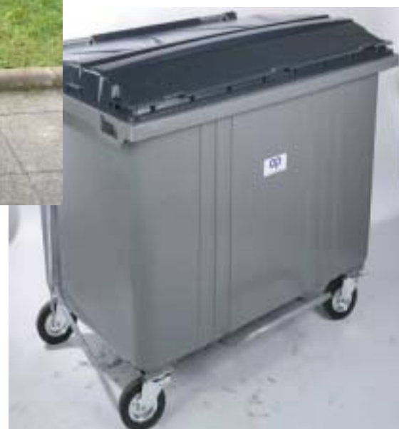
BR 1700 L