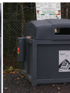
DeepLine ® Battbox 20L.