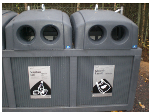
DeepLine ® med inkastöppning för glas 3m 3 eller bio-fraktion 0,7m 3 .