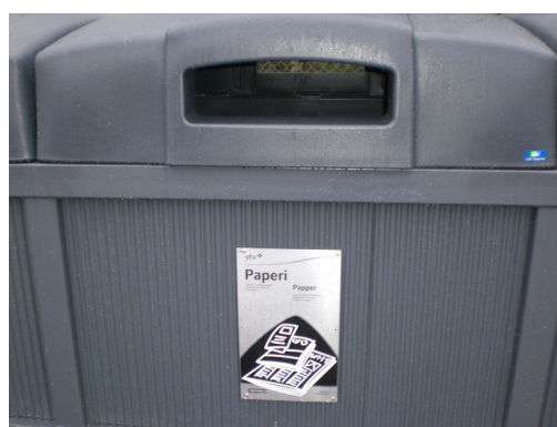
DeepLine ® 5m 3 med inkastöppning för kartong.