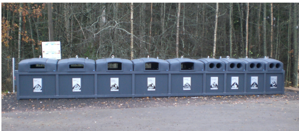
DeepLine ® anläggning med 5 stk 5m 3 för förpackningar och 3 stk 3m 3 för glas.

DeepLine ® lämpar sig för insamling av t.ex. restavfall, förpackningar (metall, plast), glas, lump m.m.